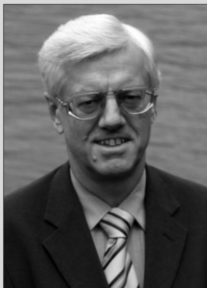
Univ.-Prof. Dr. Gerhart Holzinger

Die Dreiländertagung findet nicht, wie in der letzten Nummer angekündigt, im September, sondern am 18. und 19. Oktober 2007 in Salzburg statt und steht unter dem