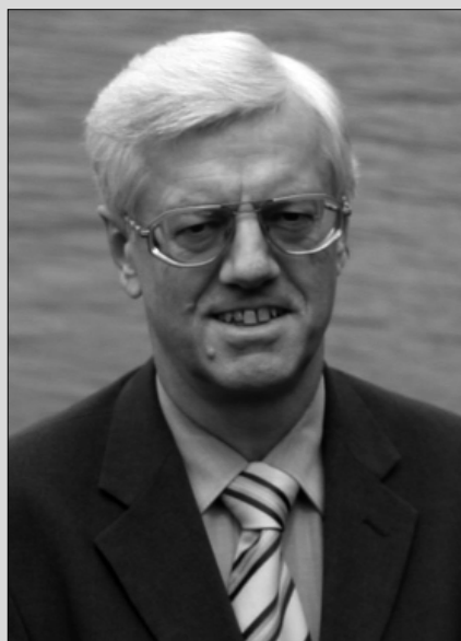
Univ.-Prof. Dr. Gerhart Holzinger

Am 18. und 19. Oktober 2007 findet unser diesjähriges Verwaltungswissenschaftliches Werkstattgespräch in Form einer Dreiländertagung in der Fürsterzbischöflichen Residenz in Salzburg statt. Es steht unter dem Generalthema "Der Öffentliche Dienst in Deutschland, Österreich und der Schweiz – Stand, Reformen, Zukunftsperspektiven". Wir laden